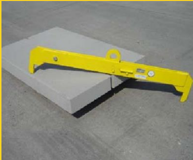
Snelleggen met behulp van een legschaar